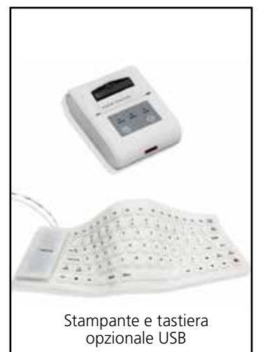
Stampante e tastiera opzionale USB