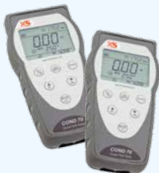
Conduttimetri COND 7 - COND 70