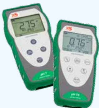
pHmetri pH 7 - pH 70

Una linea completa di strumenti portatili impermeabili e testers per pH, conducibilità e ORP nella misura in campo.