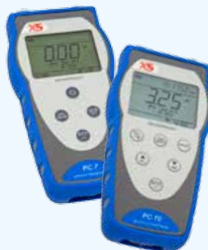
Multiparametri PC 7 - PC 70