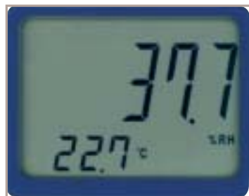
Display UR 100