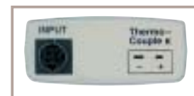
Ingresso termocoppia K UR 200