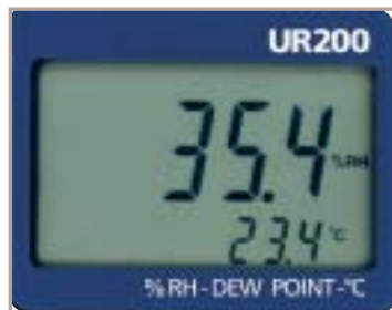
Display UR 200