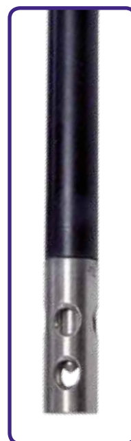
VPT 51/01 Per misure acqua ultra pura