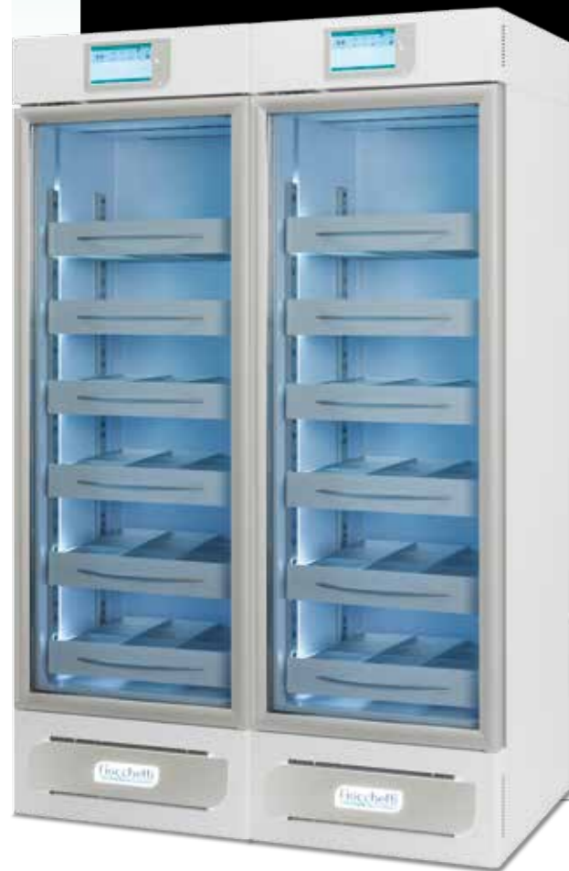
Medika 800 2T