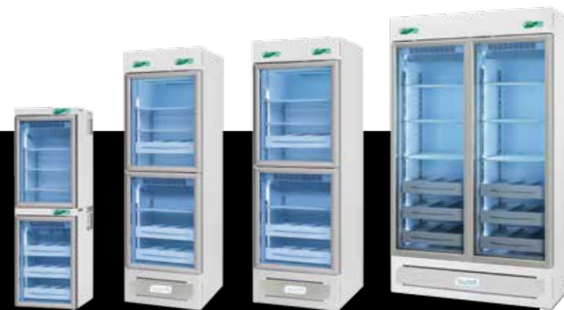
Medika 280 2T Medika 400 2T Medika 500 2T Medika 600 2T

The professional refrigerators range MEDIKA 2T have been designed specifically for pharmacies and pharmaceutical sector: two temperature settings, two cooling units and two totally independent chambers to store at best different groups of products. Each chamber can be set independently between +2° and +15°C and is provided as a standard with acoustic and visual alarms. This range offers units with different capacities, from 280 to 1500 liters, all supplied with triple layer glass doors and can be customized as far as the internal fittings (with shelves and/or telescopic drawers). The range MEDIKA 2T complies with Italian pharmacopeia and European drugs storage normative and is available in ECT-F or ECT-F TOUCH version.