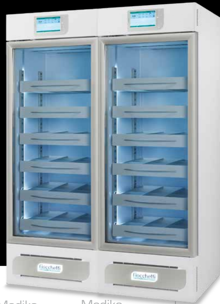
Medika 1000 2T