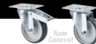
Ruote Castors kit