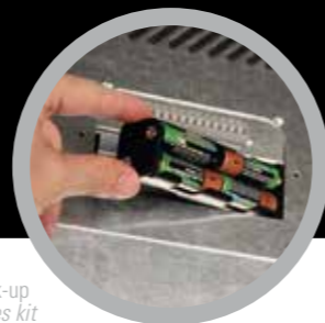
Kit Batterie back-up Back-up batteries kit