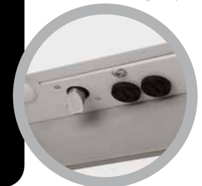
Serratura elettronica Electric digital key lock