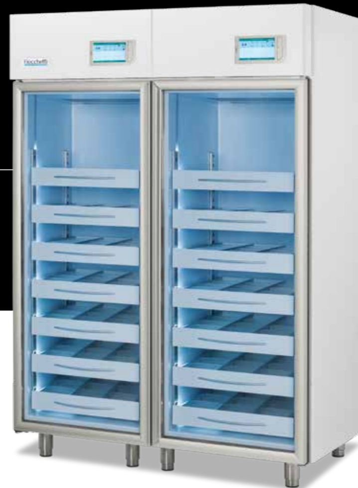
Medika 800 2T