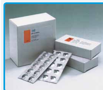
Comprende pre-dosate in blister protettivo in alluminio