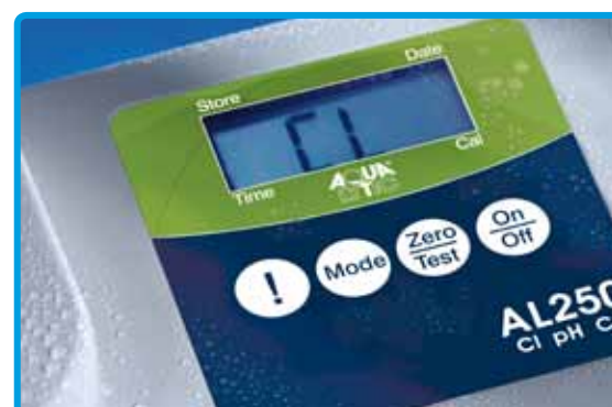
Particolare della tastiera a tenuta stagna