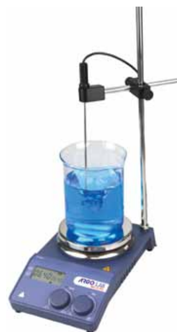
Agitatore M2-D Pro con supporto regolabile e PT 1000