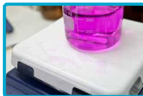
Piattello in vetroceramica a elevata resistenza chimica