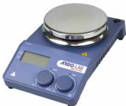
Agitatore M2-D Pro