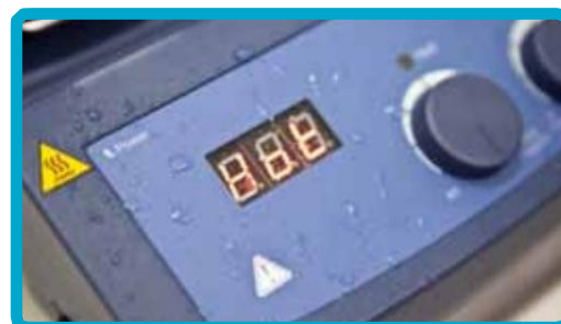
Pannello frontale a prova di spruzzi