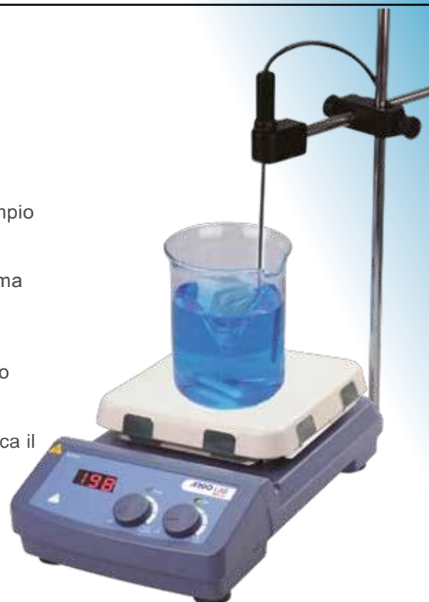
Agitatore M3-D con supporto regolabile e PT 1000